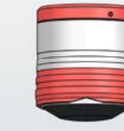
Höhe: 74, Ø 66 mm