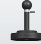
Höhe: 154,5, Ø 126 mm