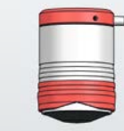
Höhe: 72, Ø 50 mm