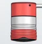
Höhe: 69, Ø 46 mm